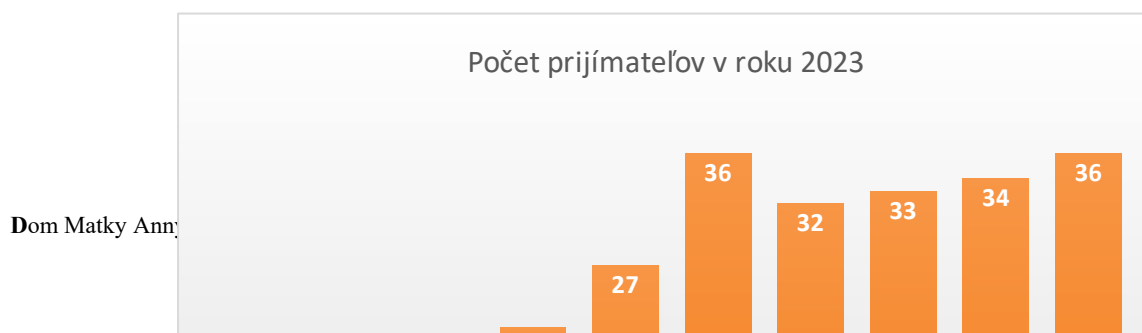
Graf č. 3

Domov seniorov Dom Matky Anny (ďalej v texte DMA) v roku 2023 poskytoval sociálne služby v priemere 27 klientom.